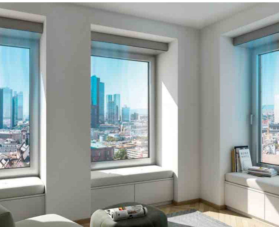
Einströmen vorgewärmter und gefilterter Frischluft in den Raum, ohne das Fenster zu öffnen. Inflow of pre-heated and filtered fresh air into the room without opening the window.

With VentoTherm Twist, Schüco offers an efficient system solution for decentralised ventilation: ventilation integrated in the window with heat recovery – controlled air exchange without opening the window. This ensures the most efficient use of energy and the best possible room climate and air quality, all of which are decisive advantages when marketing and managing a property. VentoTherm Twist can be used in Schüco aluminium and PVC-U systems.