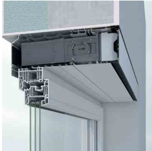
Schüco VentoTherm Twist kombiniert mit Kunststoff-System Schüco LivIng Schüco VentoTherm Twist combined with Schüco LivIng PVC-U system