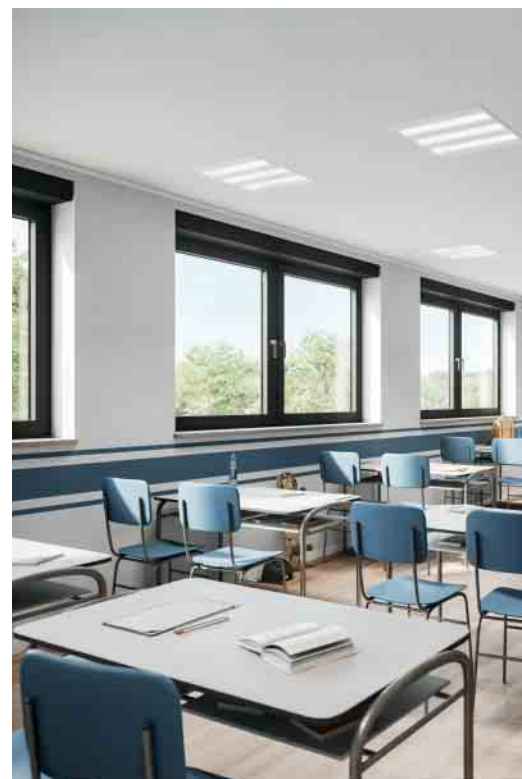
Optimal für Klassenzimmer: Frischluft ohne störende Außengeräusche Ideal for classrooms: fresh air without disturbing noise from outside