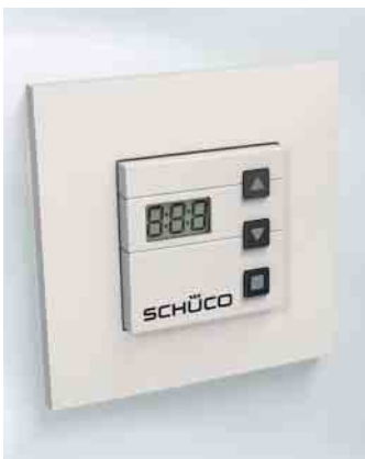
Basic-Bedienung: Tastenbedienung Basic operation: Button operation

With the Comfort operating device, Schüco VentoTherm Twist supplies the room with the required amount of fresh air completely automatically. This means that the system works according to individually defined time-based ventilation programs or it simply adjusts the level of ventilation to the actual amount needed by using the CO 2 values measured. This ensures the highest level of comfort in terms of air quality in the room and the most efficient use of energy. The Comfort operating device is very easy to install thanks to wireless communication with VentoTherm Twist.