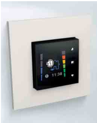
Comfort-Bedienung: Touchdisplay Comfort operation: Touchscreen